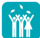
GT ENSINO MÉDIO